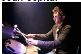
J-L. Parisot ©

Manipulateur des ombres et de la lumière, il travaille entre autres pour le Théâtre National de l'Odéon auprès d'Olivier Py, Joël Pommerat, pour Canal+ et aussi pour le cinéma auprès de chefs opérateurs comme Léo Mac Dougall ou encore Arthur Cemin. Il est le batteur de GBM, la muse, le chef d'orchestre.