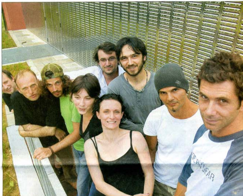
Le collectif «G Bang Machine» réuni à Montbéliard.