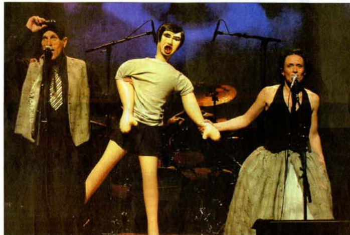
Les déchirures ou les grands moments de bonheur du couple sont la base du concert.

L'idée commence à prendre forme fin décembre 2004 dans l'esprit de l'auteur. Elle s'attelle alors à la tâche de regrouper différents textes tournants autour de ce rapport si compliqué que l'individu porte à l'amour et au couple. Ces textes qu'elle a