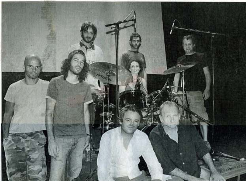
Le collectif « G Bang Machine » est à pied d'œuvre au Jules-Verne depuis le 19 août.

En mars de cette année, à l'issue de sa quête de com-